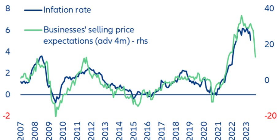
Legenda (od góry do dołu): Wskaźnik inflacji; Oczekiwania przedsiębiorstw dot. cen sprzedaży (z wyprzedzeniem 4 m) - rhs

Jak zawsze, oceny podlegają poniższemu wyłączeniu odpowiedzialności.